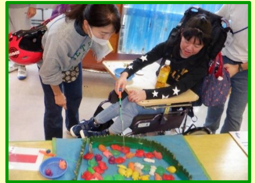
狙った魚を釣り上げます