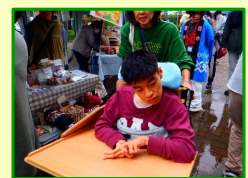
お昼ご飯を選びます