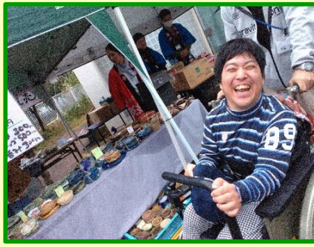
買い物は楽しめたでしょうか？