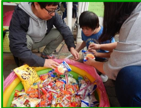
たくさんあって決まらない...?