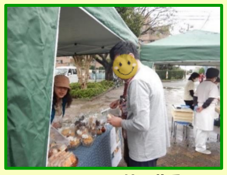
おいしそうな焼き菓子がいっぱいですね