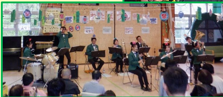
桑志高校吹奏楽部による演奏です

当日は雨模様のお天気でしたが、多くの来場者を迎える事が出来ました。20軒を超える地域のお店による物品販売や出し物も盛況で、利用者の皆さんをはじめ、来場してくれた多くの皆さんの笑顔と“楽しかった”という言葉頂く事が出来ました。ご協力頂いた皆様に感謝し、次年度も楽しいお祭りを考えていきたいと思っております(0)。