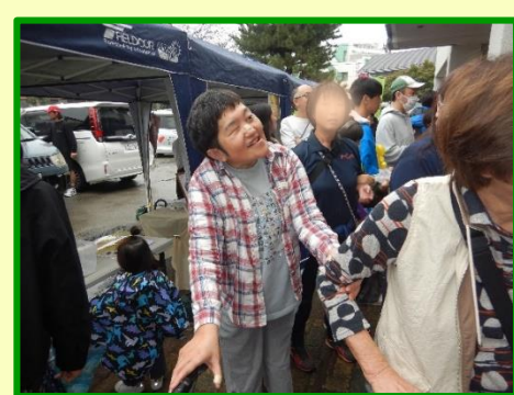
販売ブースがにぎわってます