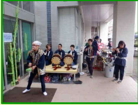
お雑子が会場を盛り上げます！