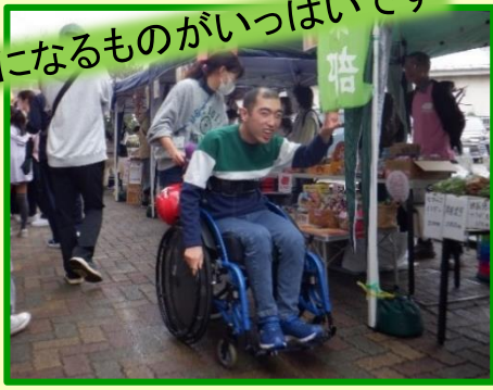
いろいろなお店に目移りします！