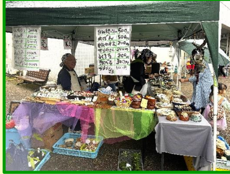
実習所の作品も売りました