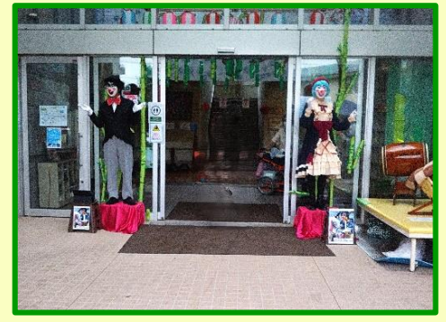
見事なパントマイムでした