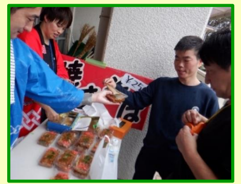
やきそばが大人気!