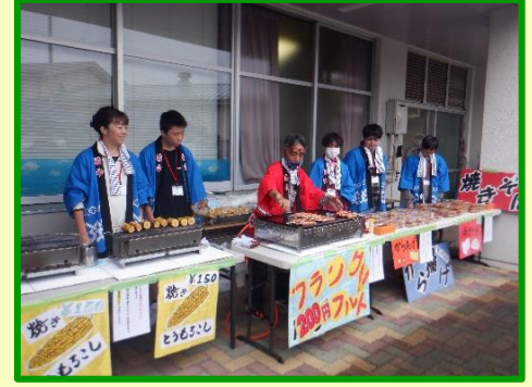
いい香りに誘われました