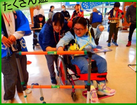
お楽しみのゲームコーナーです