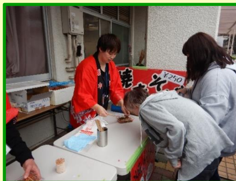
模擬店を回りました