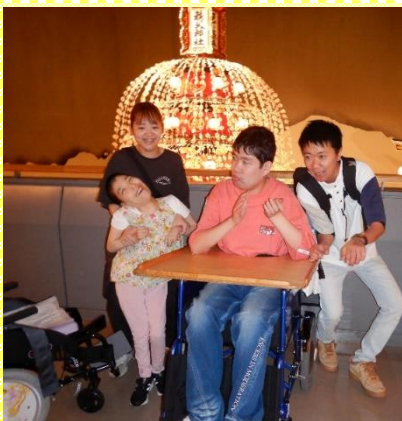
2階からおみこしのでっぺんを覗いてきました