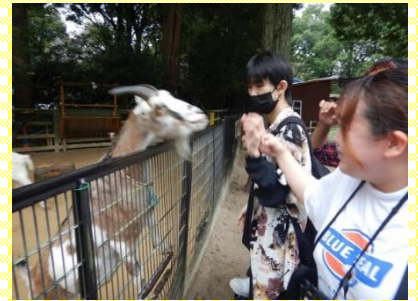
ヤギの餌やり挑戦！