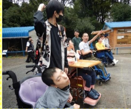
モルモットの行進をみて大盛り上がりでした