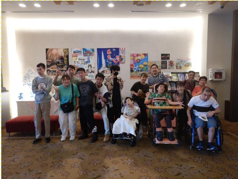
ホテルのロビーで集合写真を撮りました