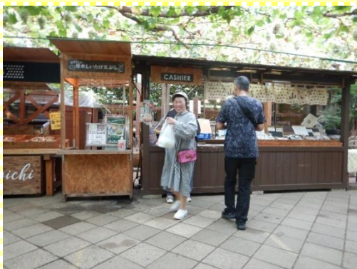
ぶどうを買ってにっこり笑顔です