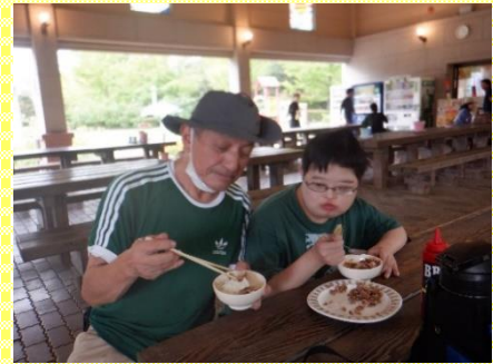
味わって食べてきました