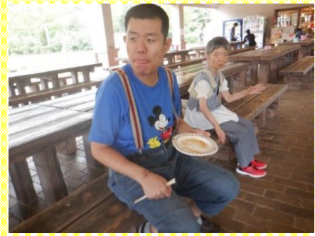
外で食べる食事は最高です