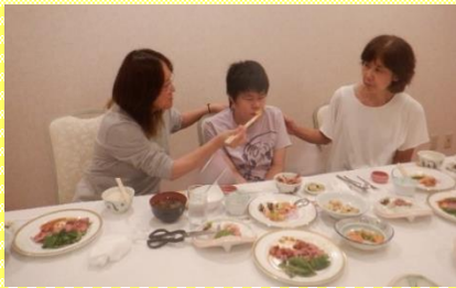
ホテルのご飯はボリューム満点です