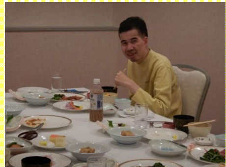
ホテルのご飯が美味しいです