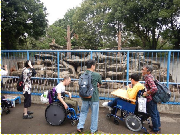
サルをみんなで見ました