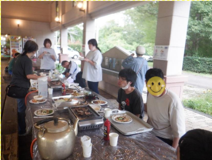
みんなでお肉を囲んでバーベキューをしました！