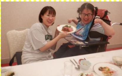
ローストビーフに満面の笑みがこぼれます