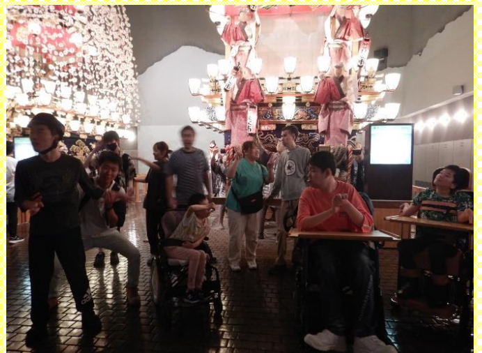
大きなおみこしを見上げました