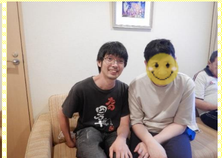
ホテルのお部屋で記念撮影です