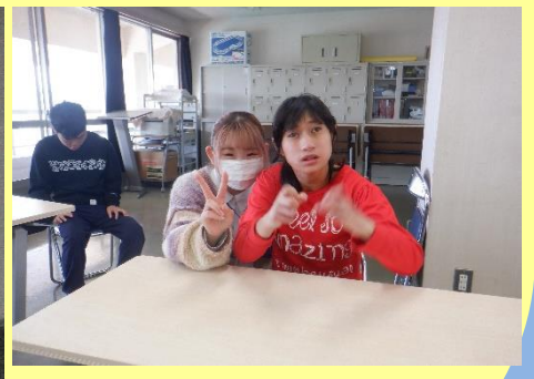
散策で心身障害者福祉 センターにきました