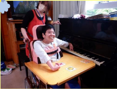
きれいな音色を響かせます!