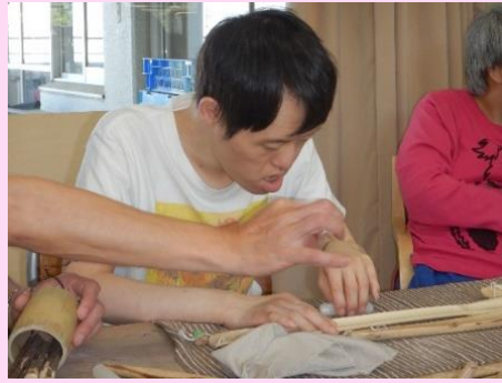
しっかり手元をみて塗ります