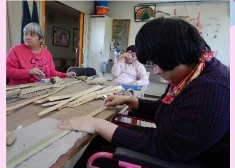
靴ペラをしっかり押さえて作業しています