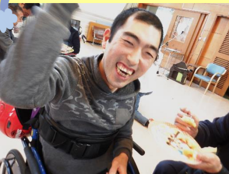
おやつレク美味しい!