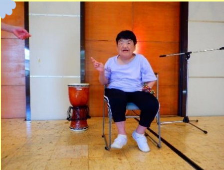
舞台の上で歌いました