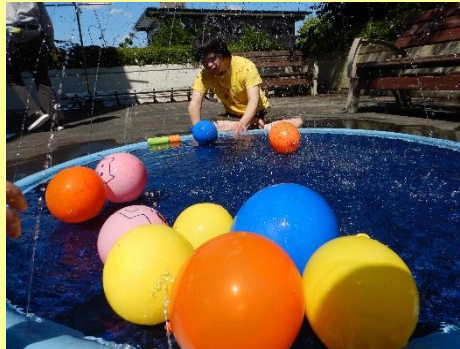
暑い日の水レク、最高です!