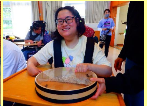
曲に合わせて演奏しました♪