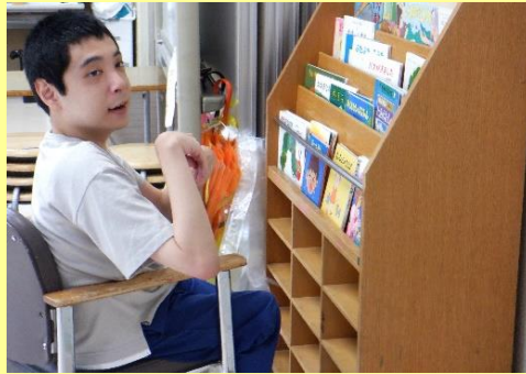
どれを読もうかな?