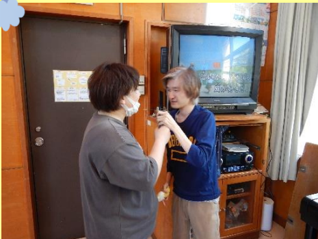
カラオケ、一緒に歌います