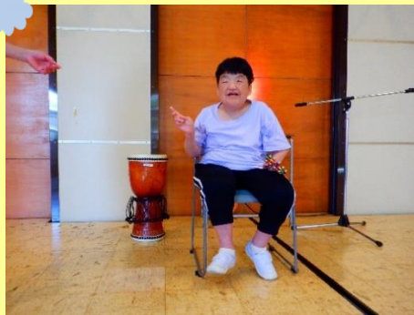
舞台の上で歌いました