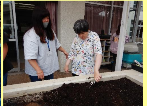
ミニトマトの苗を植える為 土を耕しました