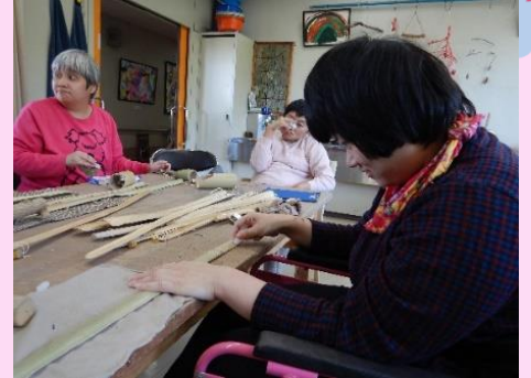
靴ベラをしっかりと押さえて作業しています