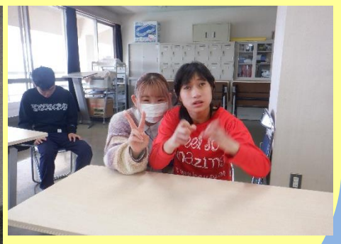
散策で心身障害者福祉 センターにきました