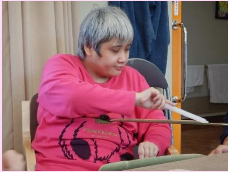
協力して蠟を塗ります