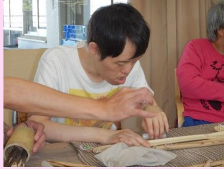
しっかり手元をみて塗ります