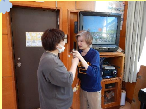
カラオケ、一緒に歌います