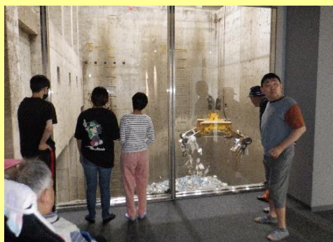
館ヶ丘のごみ処理施設を 見学してきました