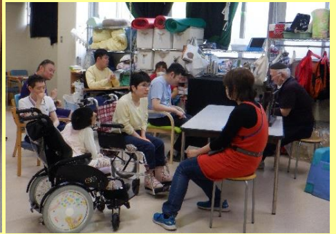
みんなで本の世界を楽しみました