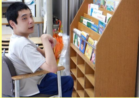
どれを読もうかな？