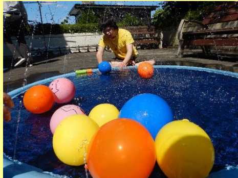
暑い日の水レク、最高です！