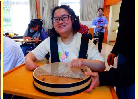
曲に合わせて演奏しました♪