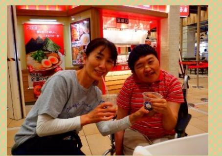
楽しいティータイム