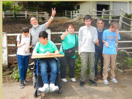
柵の前でハイチーズ📷