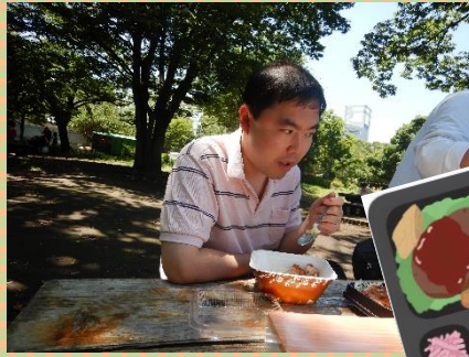
とんでも美味しそうだなあ