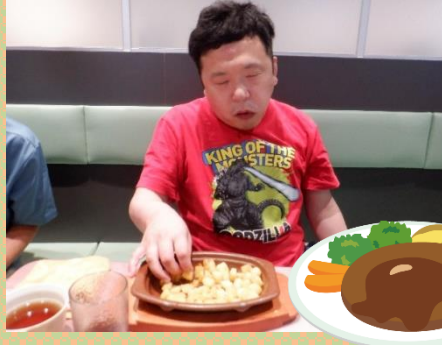
ポテトは美味しいな