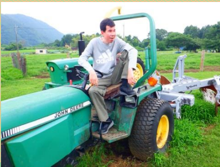
ポーズを決めてパシャリ！

宮ヶ瀬ヴィレッジカフェのお弁当を食べて、服部牧場へ。間近で牛や鳥類を見ることができ、皆さん興味津々な眼差しを向けていました。他にも名物のジェラートを食べたり、トラクターに乗り満喫しました。