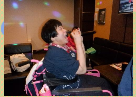
熱唱とはこのことです