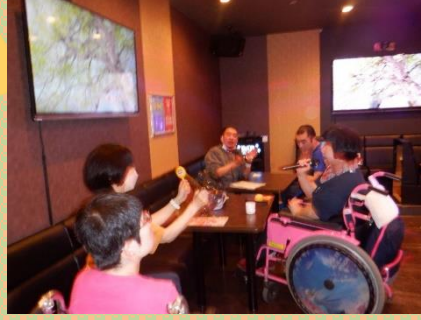
食事中も歌います