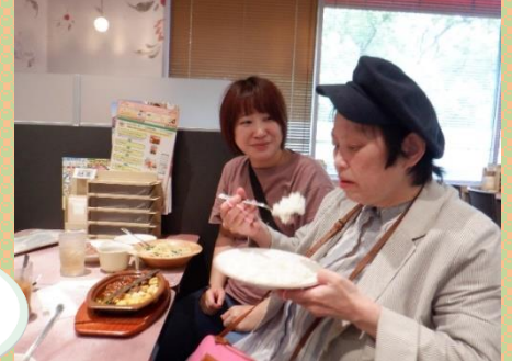
サイゼリヤでランチ