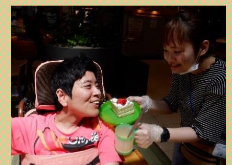
美味しくいただきます