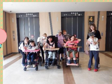
みんなで記念撮影