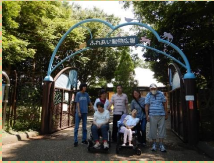
これから動物を見に行ってきます

天気にも恵まれて、麻溝公園に出かける事が出来ました。 皆さん楽しみにしていた「お弁当」も木陰の涼しい中で完食しました。 食後にはふれあい動物園を見学し、森林の中を散策して森林浴も出来ました。