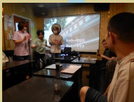
皆で盛り上がりました