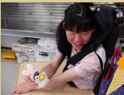
素敵なマスコットを選んできました

昼は広いフードコートで好きなものを選び食べました。ゲームセンターや店内のにぎやかなBGMを聴きながらショッピングで欲しい物を買ったり、モールならではのスイーツを満喫してきました。天気も良く行きと帰りの車内からの景色も楽しめました。