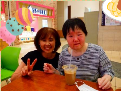
アイスラテを飲んでにっこり

モール内のオムライス専門店では、サイズがいろいろ選べ、カツがのったボリューム満点のものや、ナスとトマトのヘルシーなもの等、それぞれお好みのもので食べました。その後も買い物やティータイムと充実した時間でした。