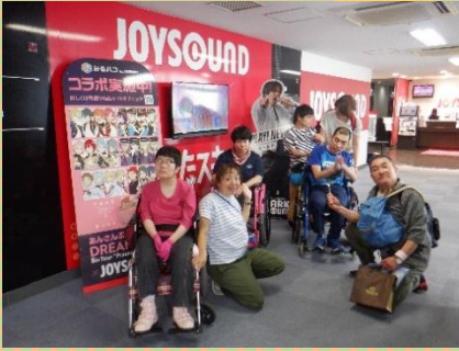
みんなでたくさん歌ってきました

「大きな声で歌って弾けよう！」をテーマに歌いまくってきました。利用者さんの中には初めてカラオケ店に行った方も！皆ムードな雰囲気の中、非日常を楽しまれていました。翌日声枯れをした人もいましたよ！