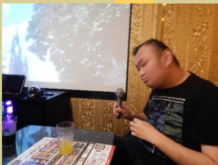
綺麗な歌声を響かせてくれています

雨天プランで、カラオケを皆さんで楽しむことができました。広々とした部屋でたくさん歌ってきました。ノリノリで曲に合わせた振付をしてくださる方もいました。帰り際、一人一人の笑顔が印象的でした。