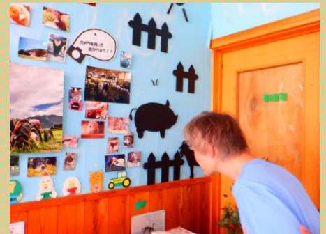
動物の写真がたくさん飾ってありました