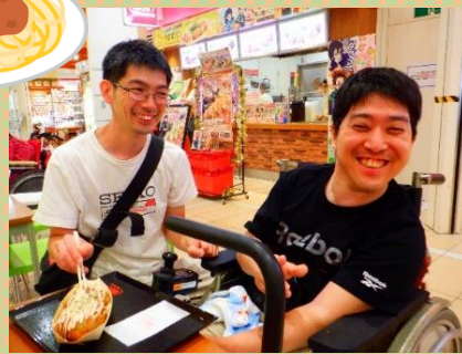
まだまだ食べたい！