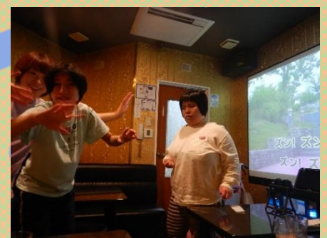
曲に合わせて身体を動かしました。