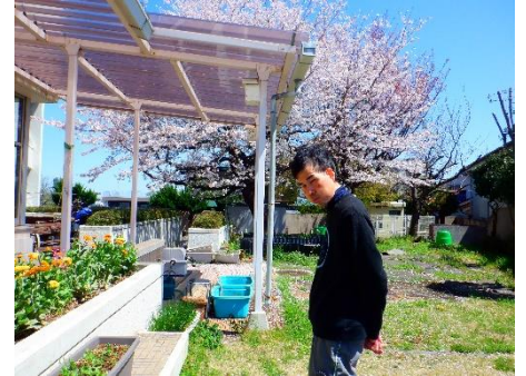
散策にも良い所です