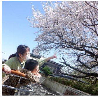
実習所のテラスです