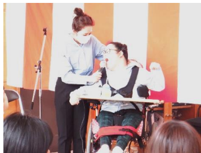
一緒に楽しみましょう