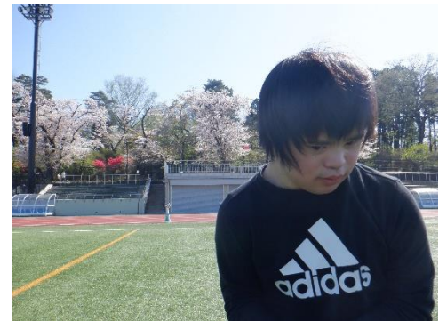
この桜も有名ですね