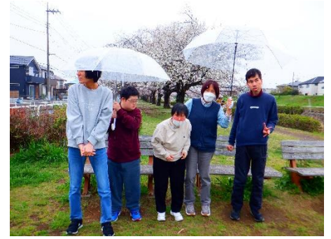
桜雨も綺麗ですね