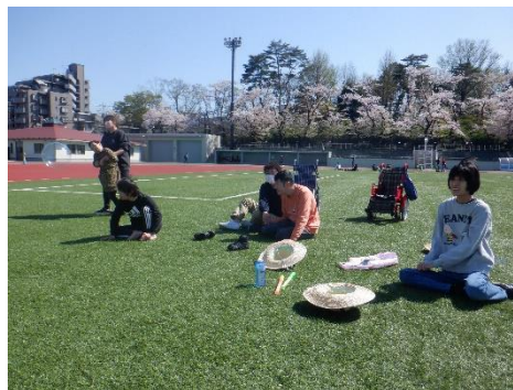
アクティブ活動で 富士森競技場へ！