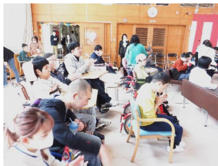
暖かい拍手でお出迎え