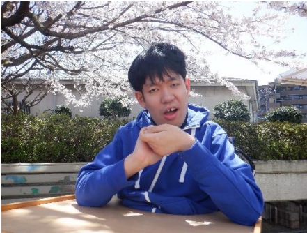
実習所の桜も見事です