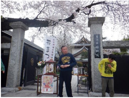
信松院の花まつり

春といえば桜。 今年も、綺麗に桜が咲きました。 実習所でも色々な所へお花見に行きました。