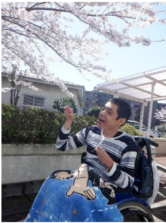
思わず笑みがこぼれます