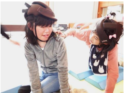
フィットネス、お互い頑張ろう