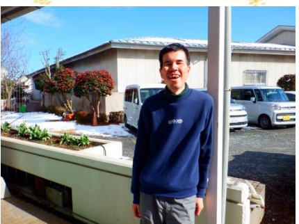
かくれんぼ中です