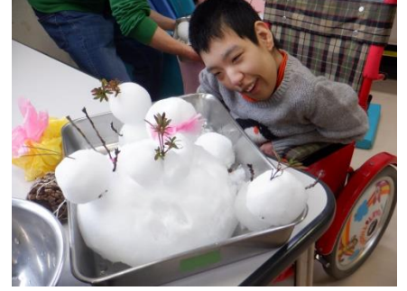
雪だるまが出来上がって、にっこり♡