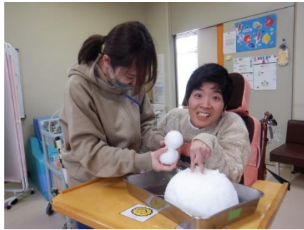
雪に触って、冷たい！