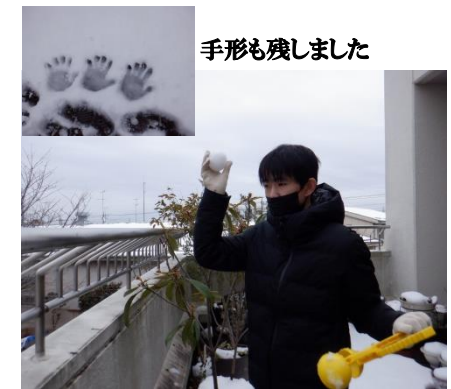
手形も残しました