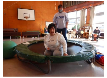
トランポリンに挑戦です