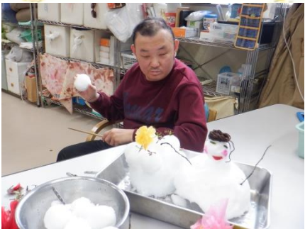
雪を感じています