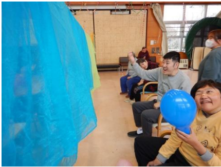
風船バレーを楽しみます