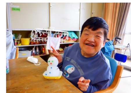
雪だるま出来たよ~